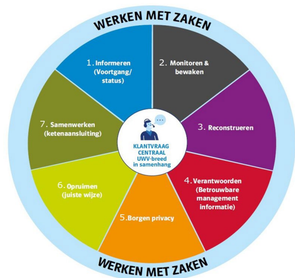
Figuur 1: Bijdrage WmZ aan UUV-brede bedrijfsdoelen

Door als UWV te werken met zaken zetten we een stap vooruit t.a.v. UWV-brede bedrijfsdoelen (zie het cirkeldiagram). In eerste instantie ligt de focus op de bijdrage aan het informeren over de voortgang en status van een klantverzoek. Daarnaast levert Werken met Zaken ook toegevoegde waarde aan de andere bedrijfsdoelen.