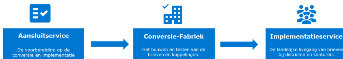
Figuur 2: De 3 stappen in de fabrieksmatige aanpak

Na de eerste implementatie bij SMZ Claim zullen in 2023 t/m 2025 nog ca. 20 implementaties bij de verschillende divisies/domeinen volgen. Om deze efficiënt te kunnen aanpakken is, mede op basis van de ervaringen bij de first user, een fabrieksmatige aanpak ontwikkeld. Hiermee kunnen we de totale doorlooptijd voor de verdere uitrol verkorten. Volgens een strakke aanpak wordt per onderdeel eerst een aansluitservice doorlopen dat resulteert in een aansluitplan per onderdeel. Vervolgens worden in 'de conversiefabriek' de brieven omgezet en tenslotte via een standaard implementatieservice geïmplementeerd bij het betreffende onderdeel (zie figuur 2)